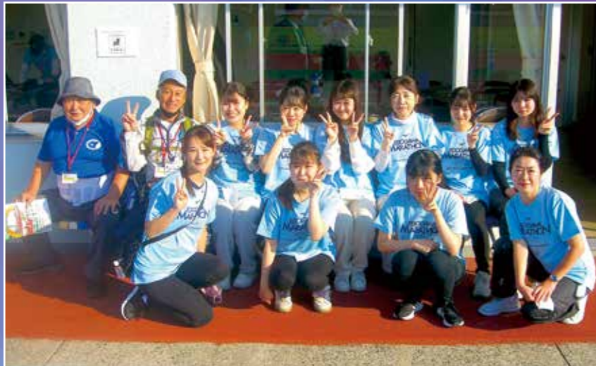
江戸川マラソン大会